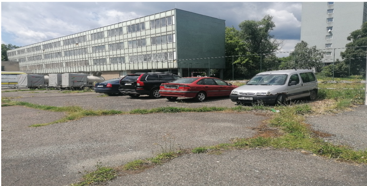
budova praktického vyučovania (súpisné číslo 10301)